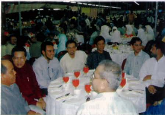
Ahli jawatan kuasa Masjid Khadijah dalam satu majlis.