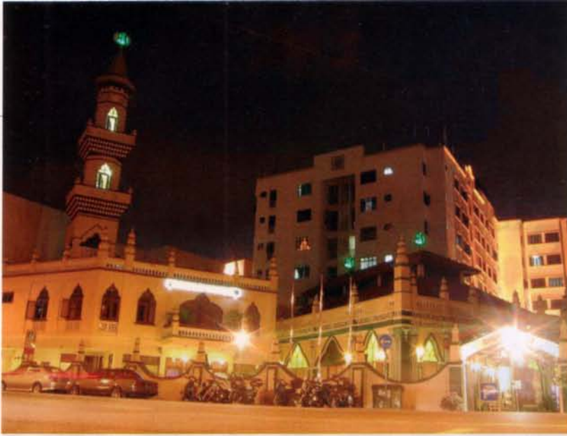
Masjid Khadijah berkilau pada waktu malam.

menikmati hidangan nasi beriani percuma.